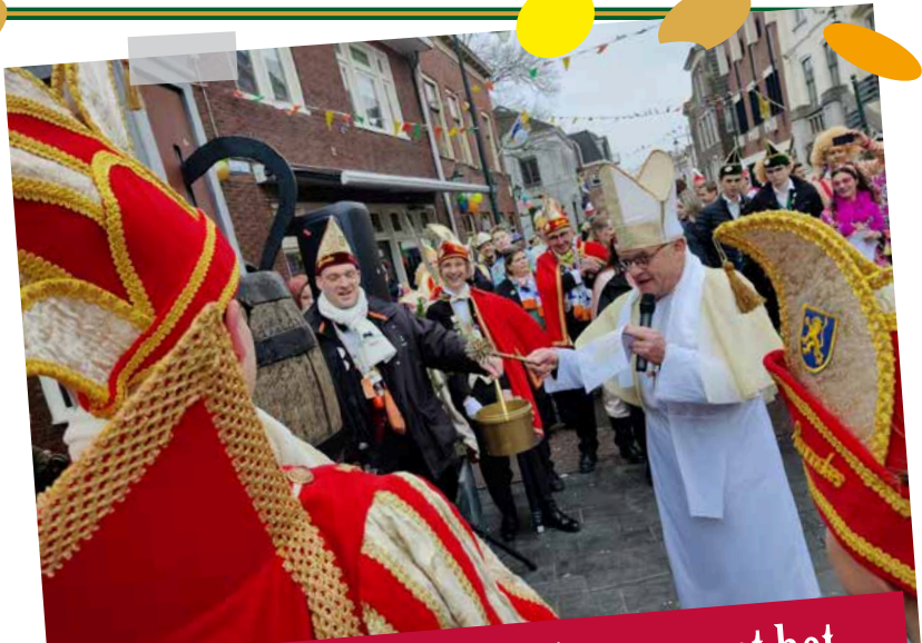
Stand-in bisschop van Biera zegent het eerste vaatje. Het dweilen kon beginnen!