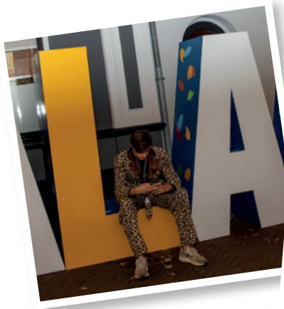
Korte foto-impresie van de elfde van de elfde XL!