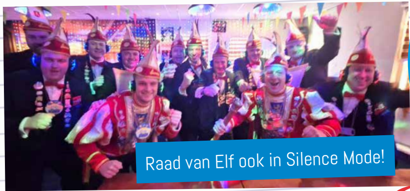
Raad van Elf ook in Silence Mode!