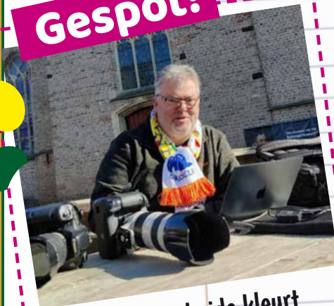
Redactie Streekgids kleurt lekker bij